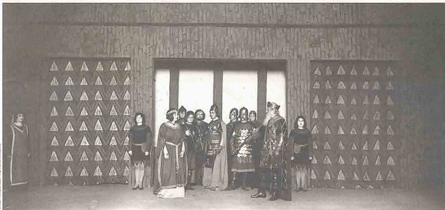
Fritz Schumachers Bühnenbildentwurf zu Shakespeares „Macbeth“ von 1920 und das danach gebaute Bühnenbild aus dem Deutschen Schauspielhaus im gleichen Jahr