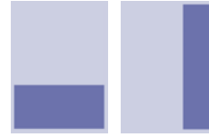
1/3 Seite quer 210x99 mm hoch 70x297 mm