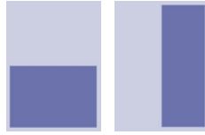
1/2 Seite quer 210x148 mm hoch 105x297 mm